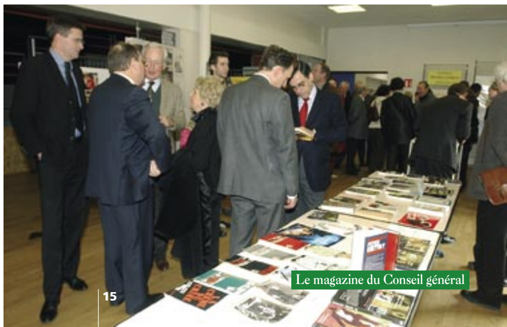
Le magazine du Conseil général

vitrées, la nouvelle bibliothèque s'étend sur une superficie de 146 m 2 . Avec plus de 600 inscriptions et 6 000 ouvrages provenant du fonds local, de dons de l'association de "Petit poulet lecteur", de Jean-Louis Touchant, adhérent de l'association 813, créée par Michel Lebrun et Pierre Lebedel, et du fonds de la bibliothèque départementale de la Sarthe. La bibliothèque aidée de ses 13 bénévoles propose, outre l'accueil des écoles de la communauté de communes des Pays de Loué, "l'heure du conte" tous les mercredis.